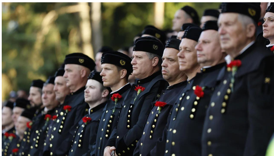
Slika 1: Velenjski rudarji.