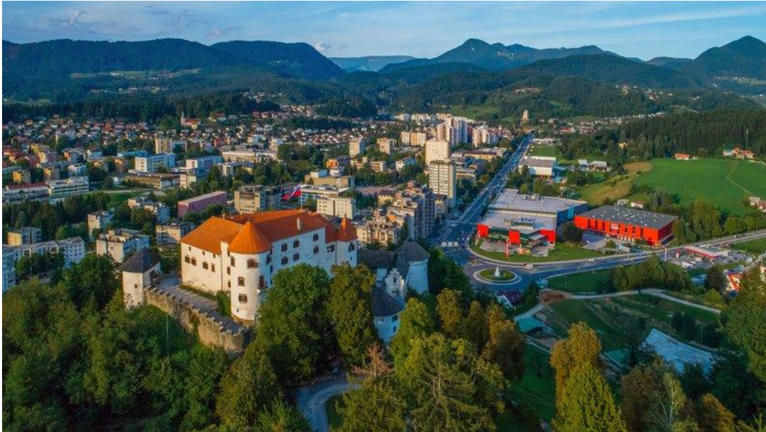
Slika 2: Velenje.