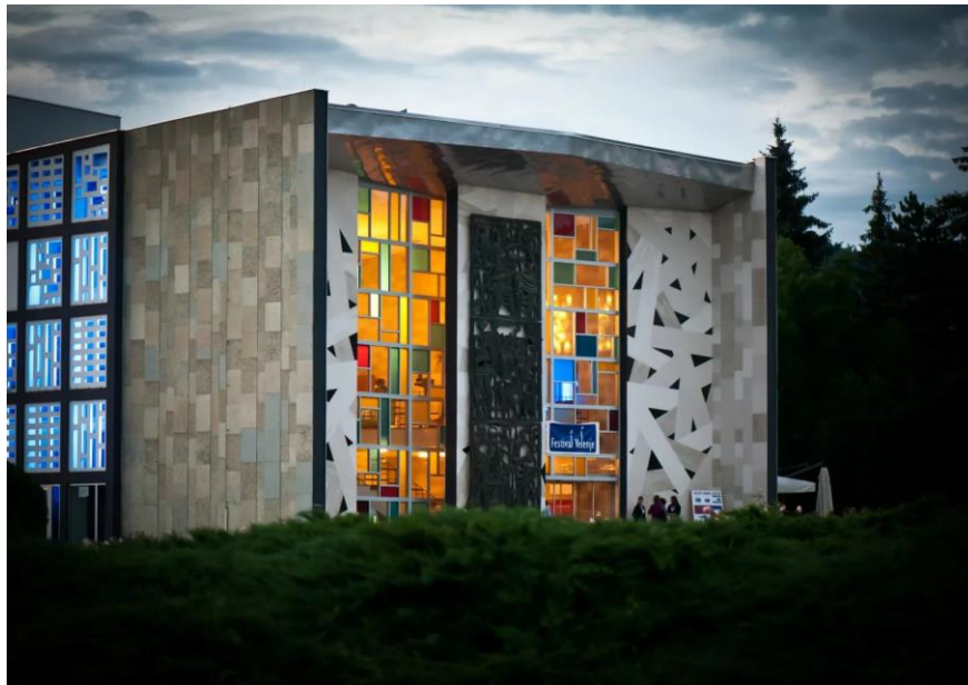
Slika 5: Dom Kulture Velenje.