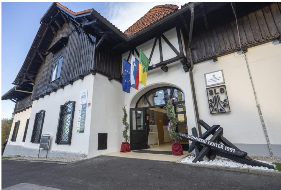
Slika 6: Spominski center 1991.