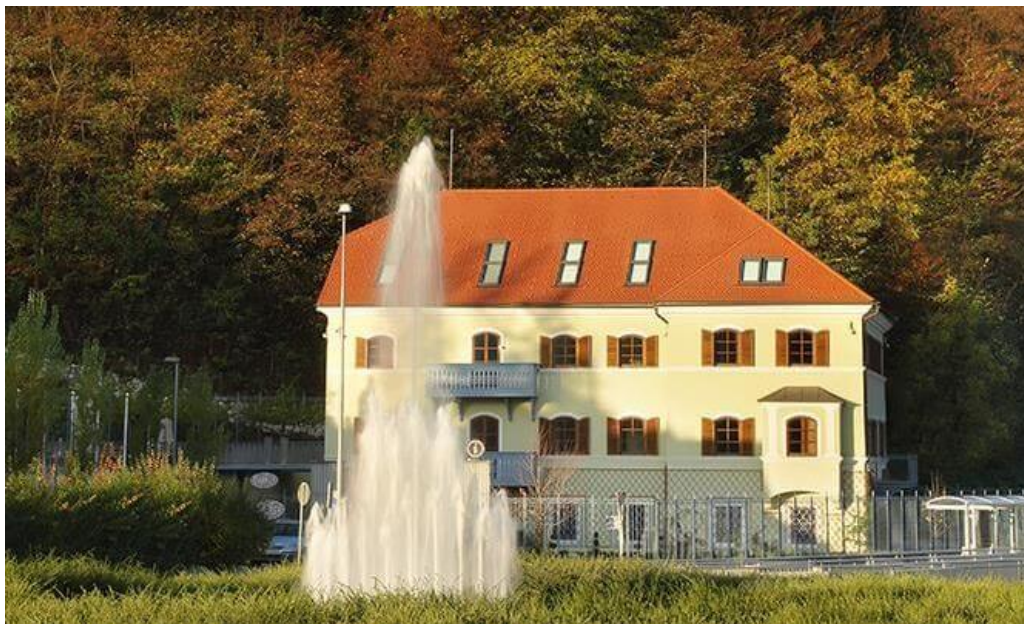
Slika 3: Vila Bianca.